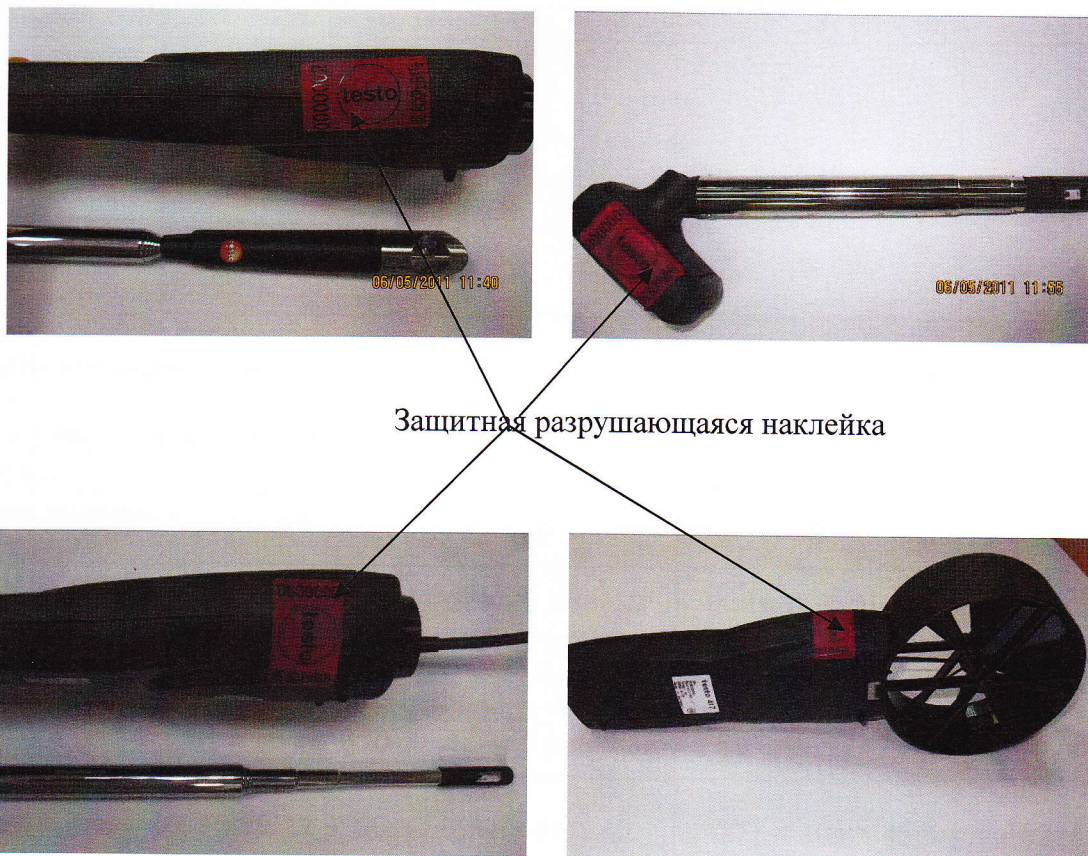
Защитная разрушающаяся наклейка