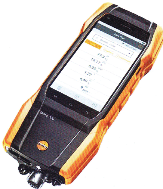
Рисунок 1 – Общий вид анализатора

Общий вид анализаторов представлен на рисунке 1.