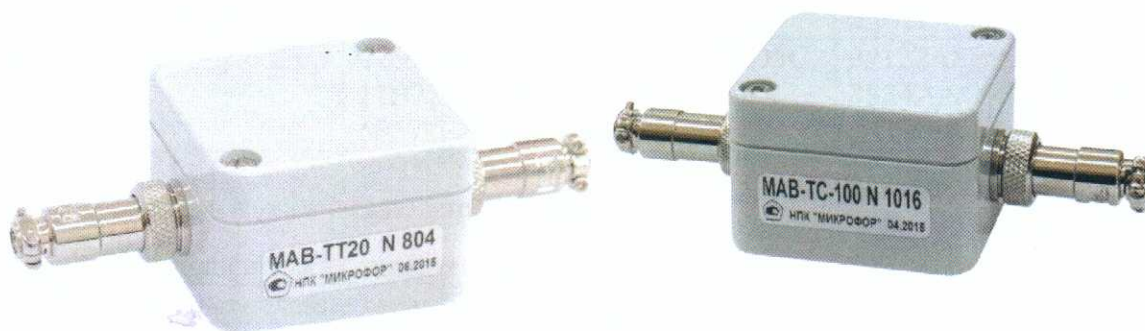
Рисунок 1 - Общий вид модулей

Общий вид модулей с местом пломбировки представлены на рисунках 1,2.