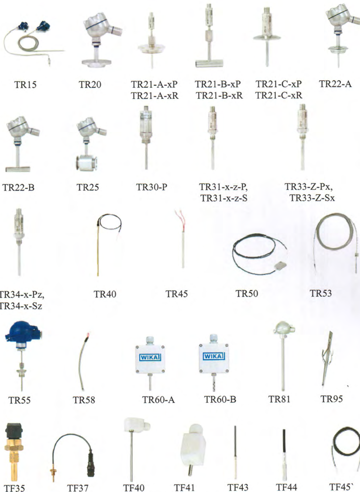
Рисунок 1 - Внешний вид термопреобразователей

Метрологические и технические характеристики приведены в таблице 1.