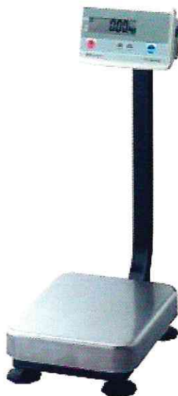
Рисунок 1 – Общий вид весов FG

Общий вид весов представлен на рисунке 1.