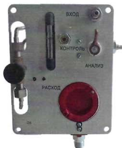
б) БД сигнализаторов