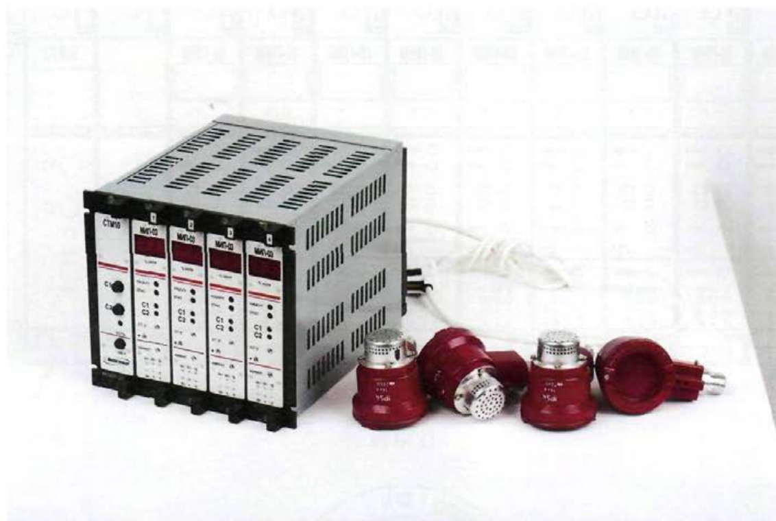
а) БСП с ВД

Схема пломбировки от несанкционированного доступа приведена на рисунке 2.