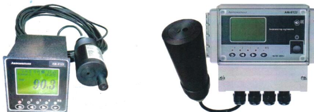
а) щитовой контроллер с погружным датчиком

Общий вид анализаторов изображён на рисунке 1.