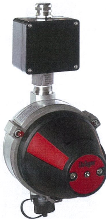
Рисунок 1 – Датчик оптический инфракрасный Dräger модели Polytron IR

Внешний вид датчиков приведен на рисунках 1 - 4. В зависимости от комплектации (например, вид клеммной коробки, защиты от внешних воздействующих факторов, адаптера для подачи ГС и др.) внешний вид датчика может изменяться.