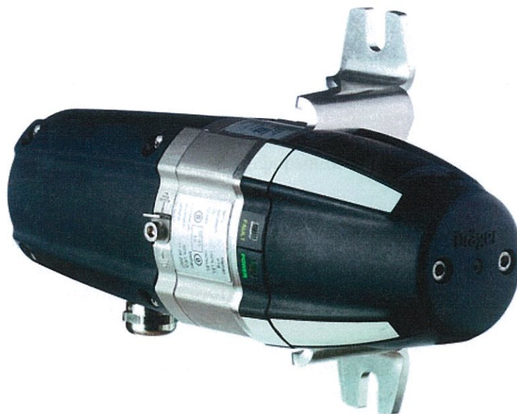
Рисунок 3 - Датчик оптический инфракрасный Dräger модели PIR 7200