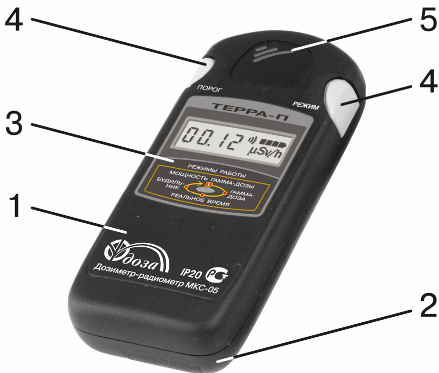
Рисунок 1.1 – Общий вид дозиметра