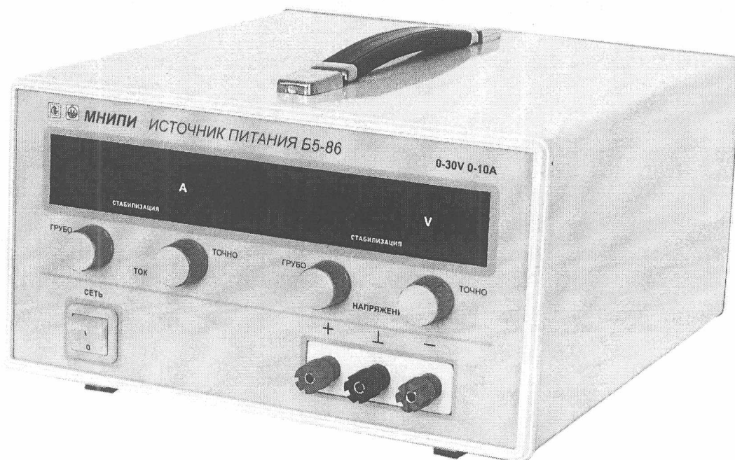
Рисунок 1 – Источники питания постоянного тока Б5-86, Б5-86/1. Внешний вид