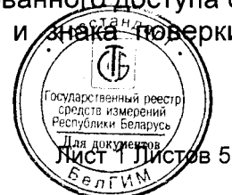
Схема пломбирования источников питания от несанкционированного доступа с указанием мест для нанесения оттиска поверительного клейма и знака поверки (клеймо-наклейка) приведена в приложении А к описанию типа.

Внешний вид источников питания представлен на рисунке 1.