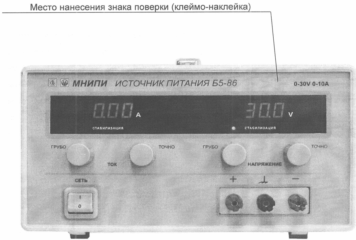
Рисунок А.2 - Место нанесения знака поверки