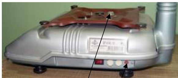
Места расположения пломб весов ВР 4149-10, ВР 4149-11