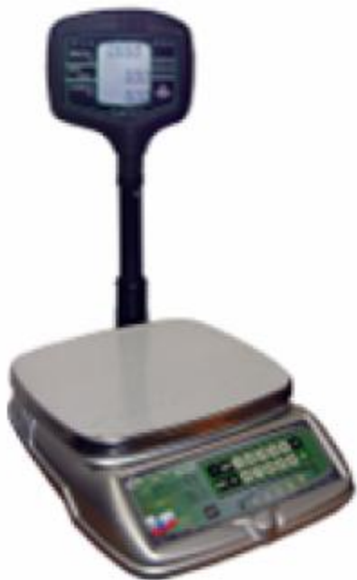
BP 4149-10A, BP 4149-11A