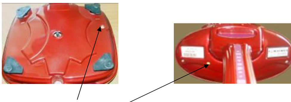
Места расположения пломб весов ВР 4149-14, ВР 4149-15