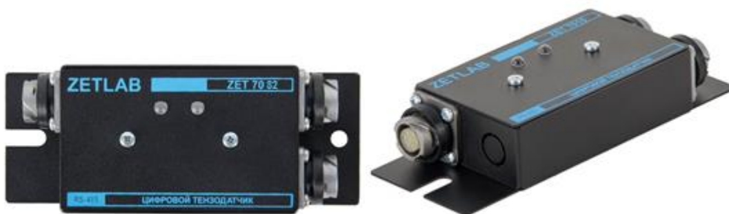
Рис. 2.2 Внешний вид регистратора в промышленном исполнении

На Рис. 2.2 представлен внешний вид регистратора ZET 7x82, выполненного в промышленном исполнении. Цифровой датчик крепится на объекте измерений по двум точкам, через отверстие \varnothing 6,2 мм на одной стороне датчика и паз шириной 6,2 мм на другой стороне датчика, позволяющий производить крепление цифрового датчика с базовым расстоянием 125 \pm 5 мм. При установке цифровых датчиков на бетонные поверхности следует использовать анкерные шпильки, либо анкера с внутренней резьбой М6. Установку на металлические поверхности производить на приварные шпильки М6, либо болтами М6 к крепежным отверстиям.