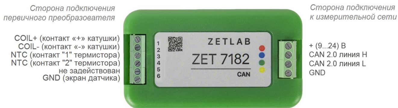
Рис. 2.4 Обозначения контактов ZET 7182 в лабораторном исполнении

На Рис. 2.4 отображено обозначение контактов регистратора ZET 7182, выполненного в лабораторном исполнении.