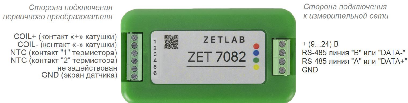
Рис. 2.3 Обозначение клемм ZET 7082 в лабораторном исполнении

На Рис. 2.3 отображено обозначение клемм регистратора ZET 7082, выполненного в лабораторном исполнении.