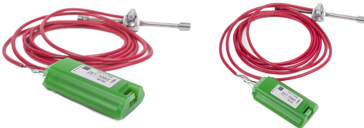
Рис. 2.1 Внешний вид регистратора в лабораторном исполнении с подключенным к нему струнным датчиком деформации

На Рис. 2.1 представлен внешний вид регистратора ZET 7x82, выполненного в лабораторном исполнении, с подключенным к нему струнным датчиком деформации. Внутри регистратора, на нижней грани, расположен магнит, что позволяет, при необходимости, установить датчик на металлической поверхности в удобном для пользователя положении.