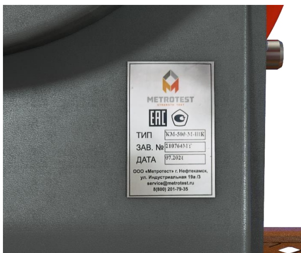
Рисунок 9 – Общий вид маркировочной таблички копров маятниковых КМ