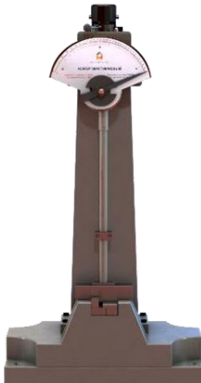
Рисунок 5 – Общий вид копра маятникового KM-150(300/450)–P–III