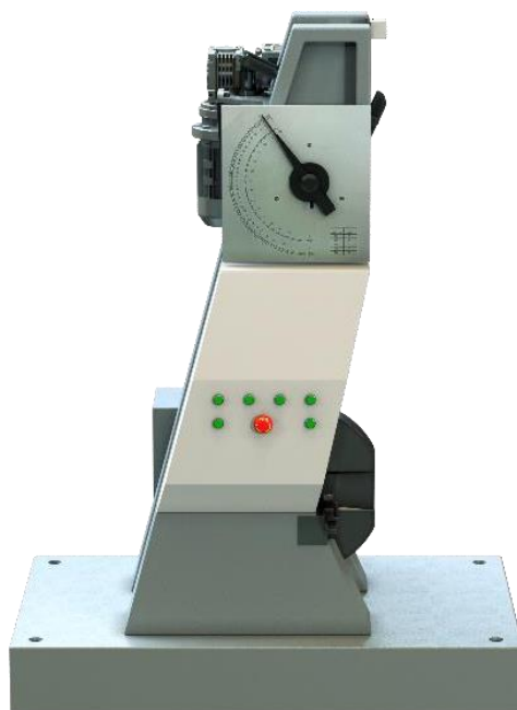
Рисунок 7 – Общий вид копра маятникового КМ.П–150(250/300/450/500/750/900)–М–Ш