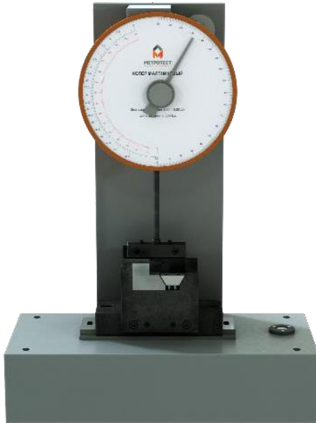
Рисунок 3 – Общий вид копра маятникового KM-5 (25/50)–P–III