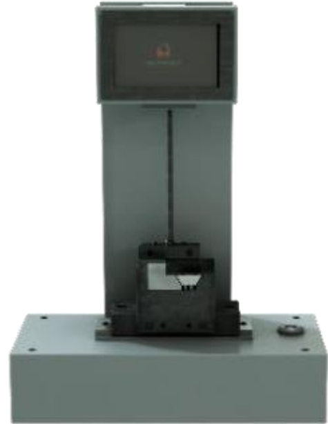
Рисунок 4 – Общий вид копра маятникового KM-5 (25/50)–P–IV