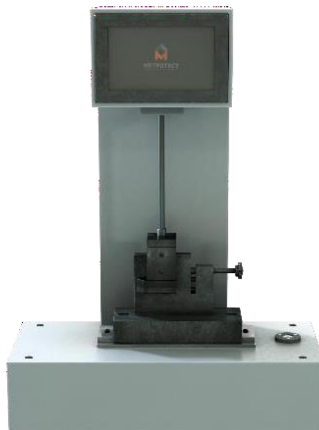
Рисунок 2 – Общий вид копра маятникового КМ-5,5 (22/44)-И-Р-ПУ