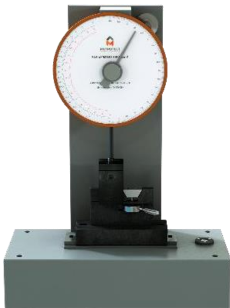
Рисунок 1 – Общий вид копра маятникового КМ-5,5 (22/44)-И-Р-Ш