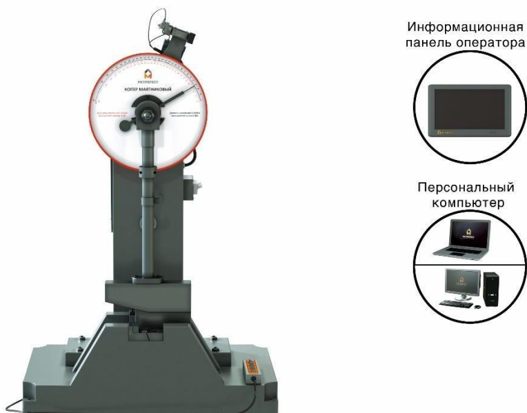
Рисунок 6 – Общий вид копров маятниковых: КМ–150(250/300/450/500/750/900)–М–Ш; КМ–150(250/300/450/500/750/900)–М–ПУ; КМ–150(250/300/450/500/750/900)–М–К