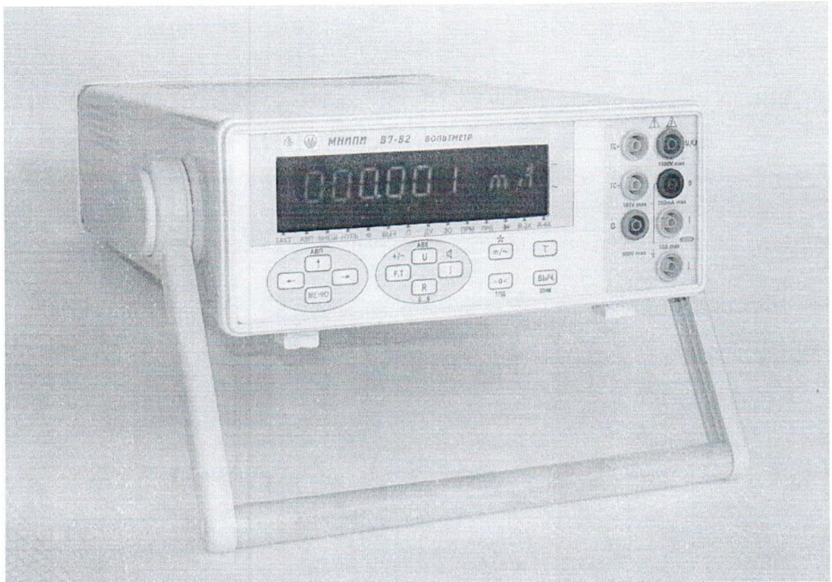
Рисунок 1.1 – Фотография общего вида вольтметра универсального В7-82 (изображение носит иллюстративный характер)