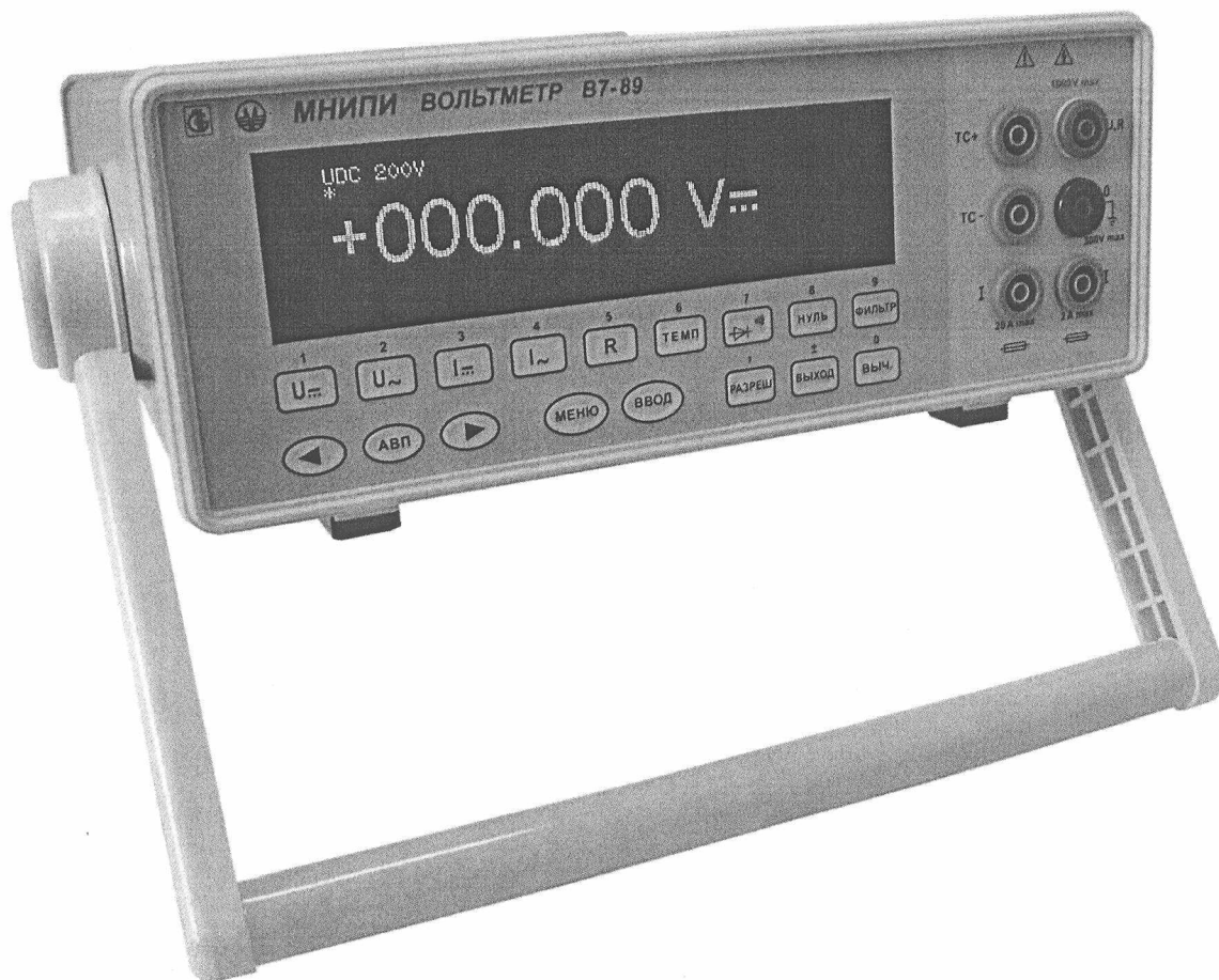
Рисунок 1 – Внешний вид вольтметра