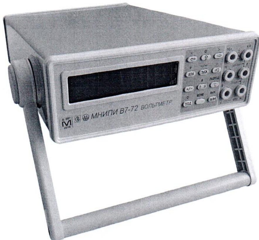
Рисунок 1 – Внешний вид вольтметров