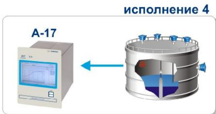
Рисунок 1 - Внешний вид системы