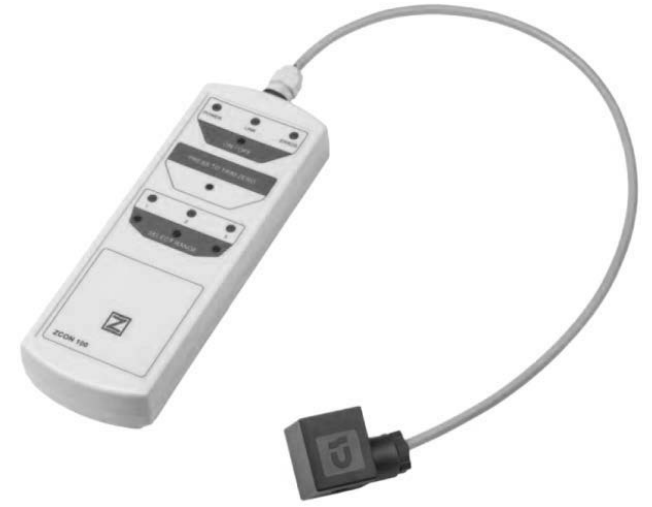
Рисунок А.1 – Внешний вид конфигуратора