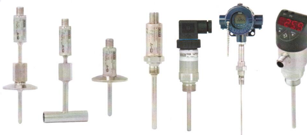
TR21-A TR21-B TR21-C TR31/33/34 TR30-W TR12-B TSD-30