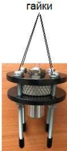
Рис. 2. Груз-фильтр

1.4.7. Пробоотборная трубка изготовлена полимерного поливинилхлоридного материала. В нижней части пробоотборной трубки находится груз-фильтр (рис. 2), внутри которого установлен фильтр из гидрофобного материала.