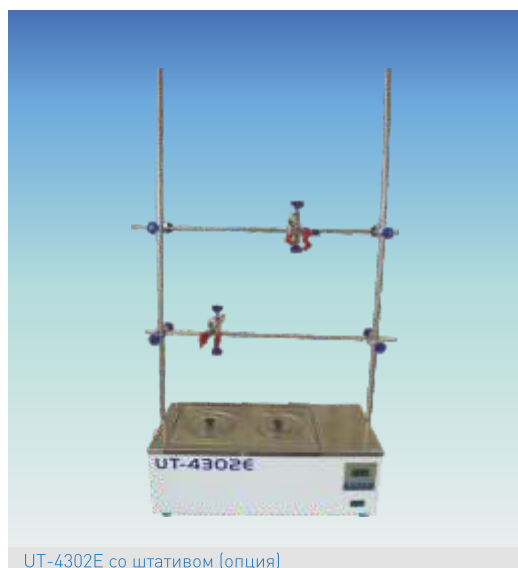
UT-4302E со штативом (опция)