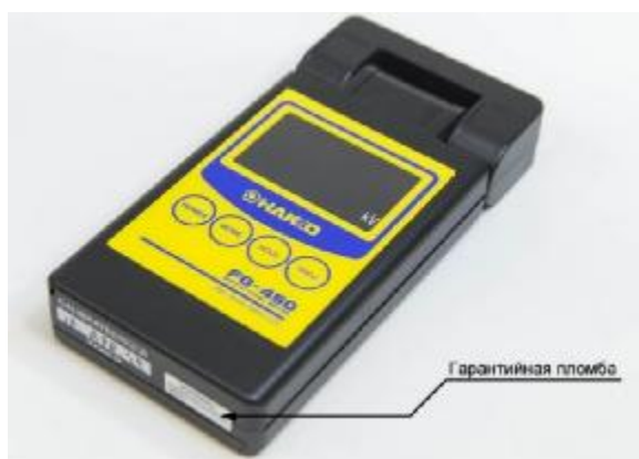
Рисунок 1 – Общий вид измерителя электростатического потенциала Nakko FG-450, место расположения гарантийной заводской пломбы.

Общий вид измерителя приведен на рисунке 1.