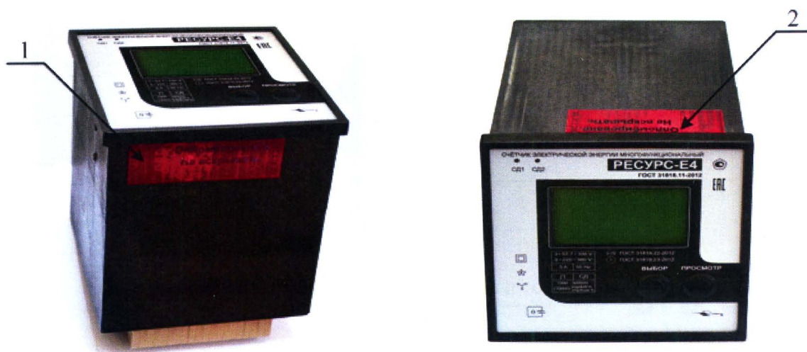
Рисунок 1 – Внешний вид и схема пломбирования счетчиков для навесного монтажа «Ресурс-Е4-Х-Х-н-Х»

Позиция 1 – место установки пломбы предприятия-изготовителя. Позиция 2 – место установки пломбы поверителя.