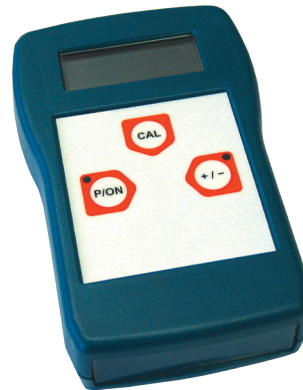
Переносной тензометрический прибор, модель E3906