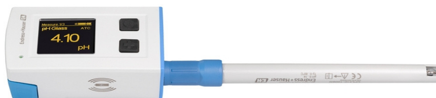
Рисунок 1 – Общий вид анализаторов жидкости переносных Liquiline Mobile

Общий вид анализаторов жидкости переносных Liquiline Mobile и их состав представлены на рисунках 1-2.