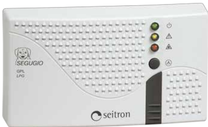
Рис. 1: Внешний вид.