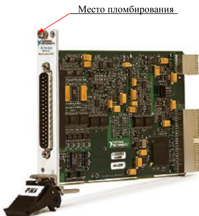
Рисунок 2 - Внешний вид преобразователей NI 6232