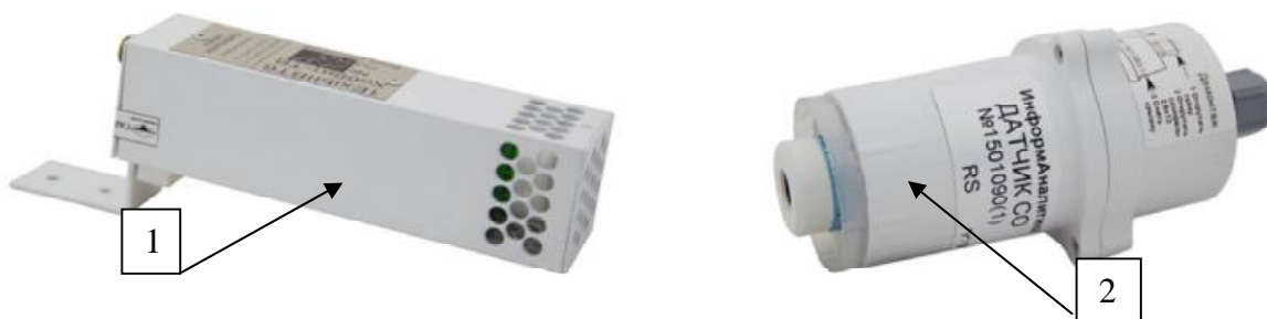
Рисунок 8 - Внешний вид выносных блоков датчиков газоанализаторов стационарного исполнения: