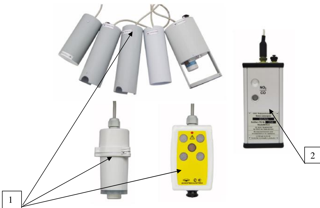
Рисунок 9 - Внешний вид выносных блоков датчиков переносных газоанализаторов: