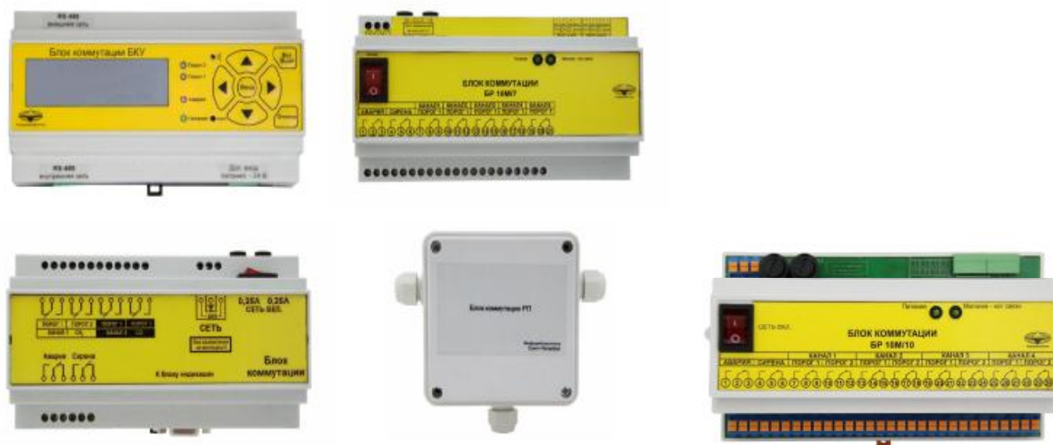
Рисунок 7 - Внешний вид блоков коммутации стационарных газоанализаторов с выносными блоками датчиков