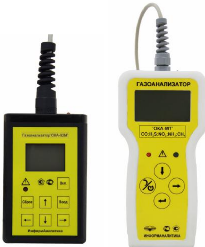
Рисунок 5 - Внешний вид блоков индикации переносных газоанализаторов с выносным блоком датчиков без взрывозащиты