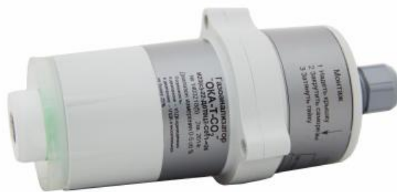
Рисунок 3 - Внешний вид стационарного газоанализатора со встроенным блоком датчика без взрывозащиты