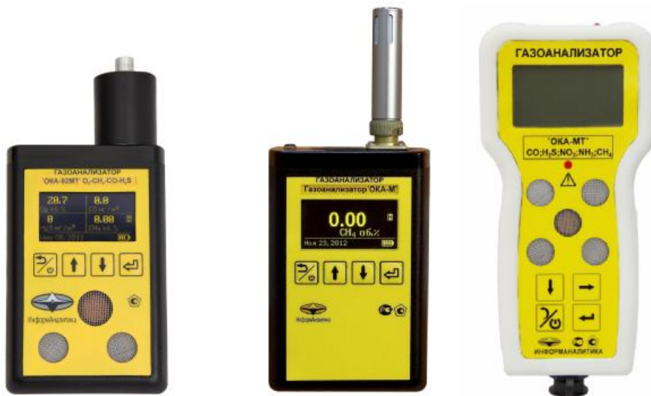
Рисунок 1 - Внешний вид газоанализаторов переносных со встроенным блоком датчиков без взрывозащиты

Внешний вид газоанализаторов и отдельных блоков представлен на рисунках 1 - 9.