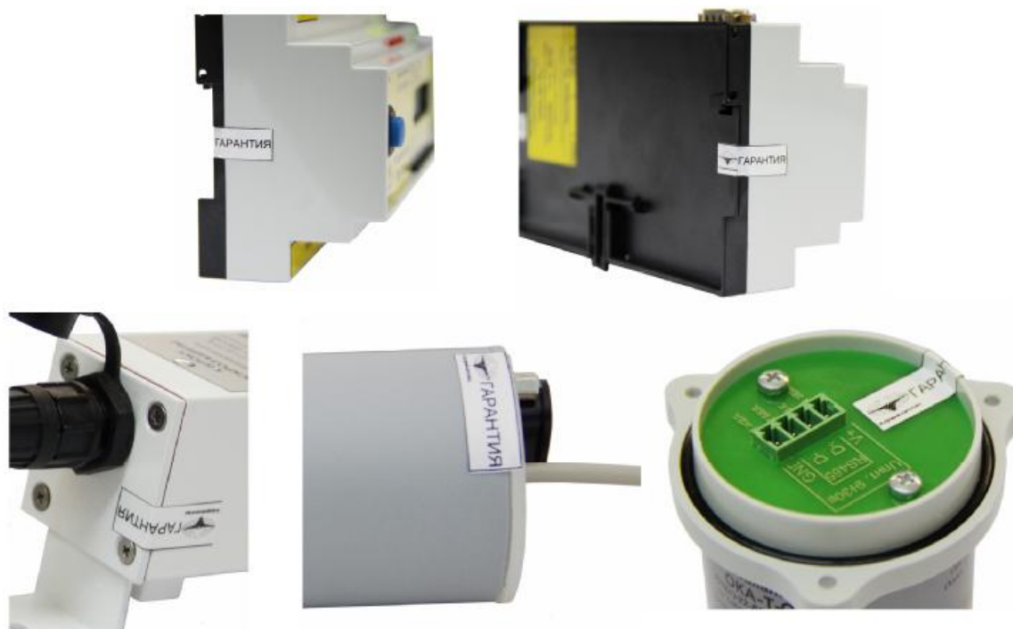
Рисунок 10 - Места пломбировки газоанализаторов и блоков