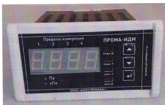
Рисунок 1 - Общий вид измерителей давления многофункциональных ПРОМА-ИДМ-016