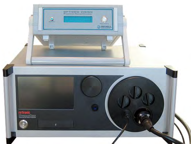
Рисунок 2. Внешний вид генератора влажного воздуха HygroGen модификации HygroGen 2. Вверху показан блок внешнего контрольного конденсационного гигрометра, внизу показан блок воспроизведения и поддержания влажности