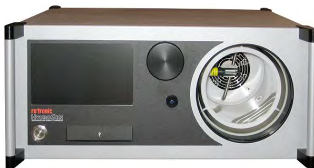
Рисунок 1. Внешний вид генератора влажного воздуха HygroGen модификации HygroGen 1.

задания влажности с помощью обогреваемых гибких трубок. К генераторам могут быть подключены внешний монитор, клавиатура и мышь для ввода задаваемых значений и просмотра графиков и таблиц с результатами измерений, флэш-карта для записи результатов измерений.