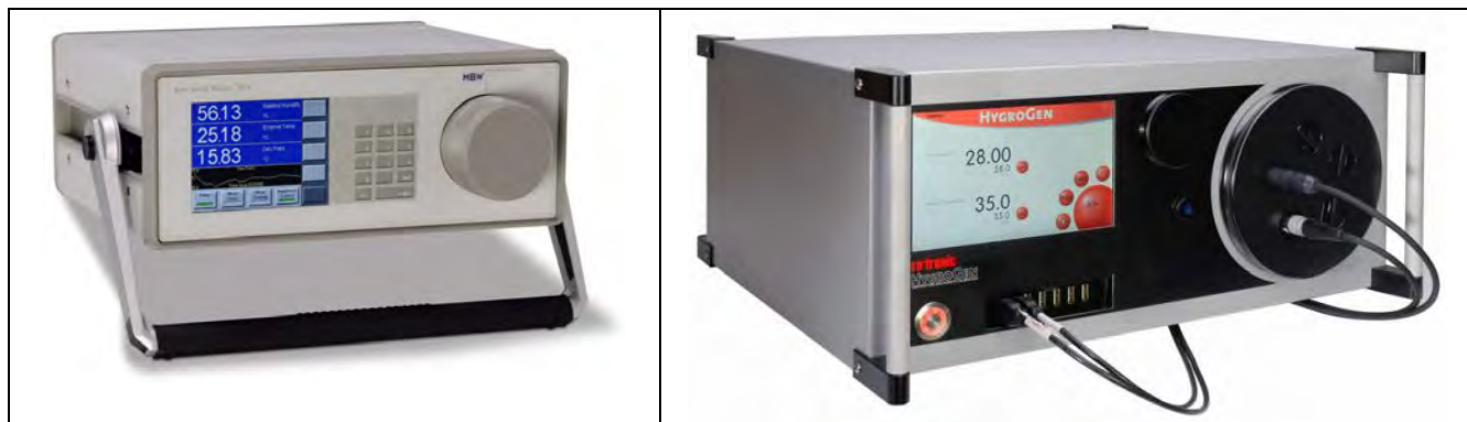
Рисунок 4. Внешний вид генератора влажного воздуха HygroGen модификации HygroGen 2-973. Слева показан блок внешнего контрольного конденсационного гигрометра, справа показан блок воспроизведения и поддержания влажности.