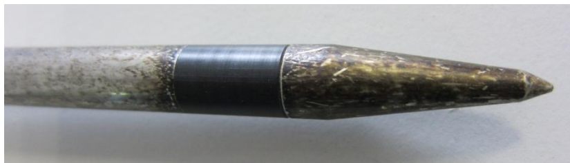
Verunreinigte Elektrodenspitze -> misst falsch!

Insbesondere Messungen in sehr feuchtem Heu können starke Verunreinigungen hinterlassen, die die Messung verfälschen können.