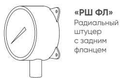
«РШ ФЛ» Радиальный штуцер с задним фланцем