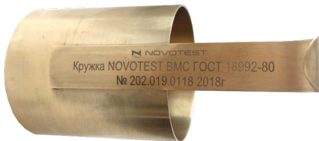
Рисунок 1.2 – Расположение данных о приборе

На ручку прибора наносится условное обозначение прибора с товарным знаком предприятия-изготовителя, заводской номер и год выпуска (рис. 1.2).