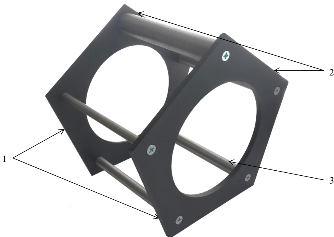
1 – пятиугольные металлические пластины; 2 – испытательные грани; 3 – испытательный стержень.