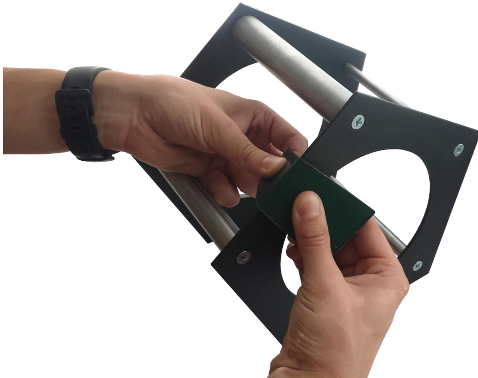
Рисунок 2.2 – Проведение испытания на грани прибора