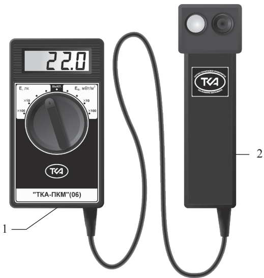
Рис.1 – Внешний вид прибора “TKA-ПКМ”(06) 1 – Блок обработки сигналов 2 – Фотометрическая головка