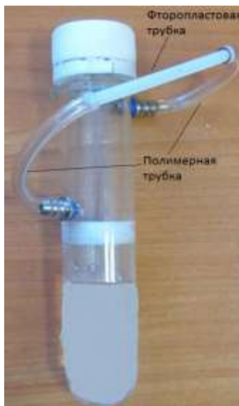
Рис.1 Картридж проверки