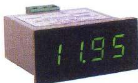
е) ПКЦ-1100 (ЦИ-1.3)