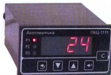
в) ПКЦ-1111 щитовой