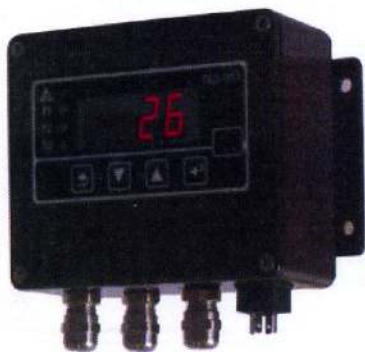
з) ПКЦ-1111 настенный