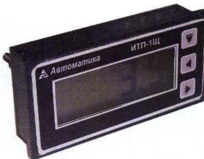
д) ПКЦ-1110 (ИТП) щитовой