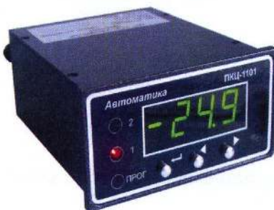
б) ПКЦ-1101, ПКЦ-1102, ПКЦ-1103