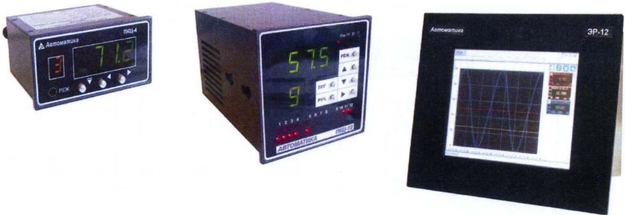
а) ПКЦ-4, ПКЦ-8