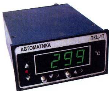
а) ПКЦ-1Э, ПКЦ-1Т.1, ПКЦ-1Т.2

Приборы серии ПКЦ имеют ряд моделей, внешний вид приборов и места пломбирования (наклейки) приведены на рисунках 1 - 3.