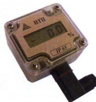
д) ПКЦ-1110 (ИТП) настенный