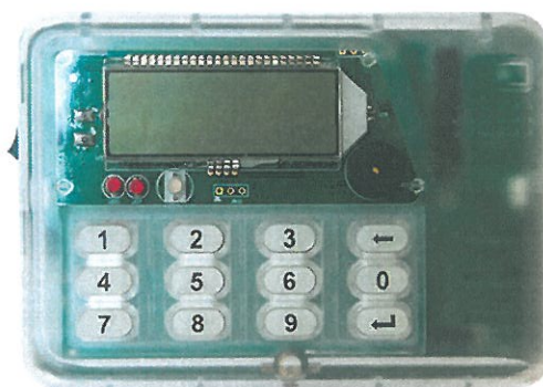
Рисунок 3 - Общий вид индикаторного устройства