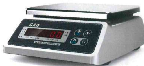
Весы с пылевозооащитным исполнением оболочки (корпуса)