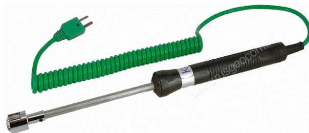
Рисунок 6 - Общий вид зонда модели TR-10S