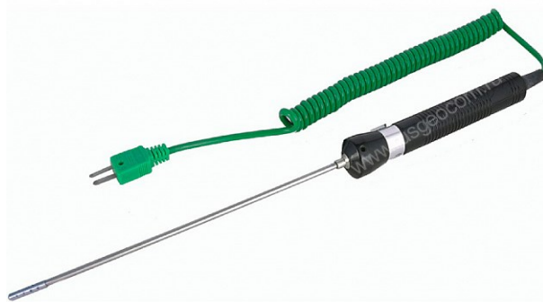
Рисунок 5 - Общий вид зонда модели TR-10А