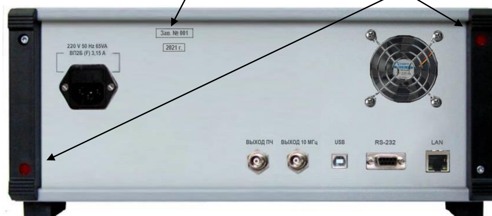
Рисунок 2 – Схема пломбировки от несанкционированного доступа, обозначение мест нанесения знака поверки

Места пломбировки с нанесением знака поверки