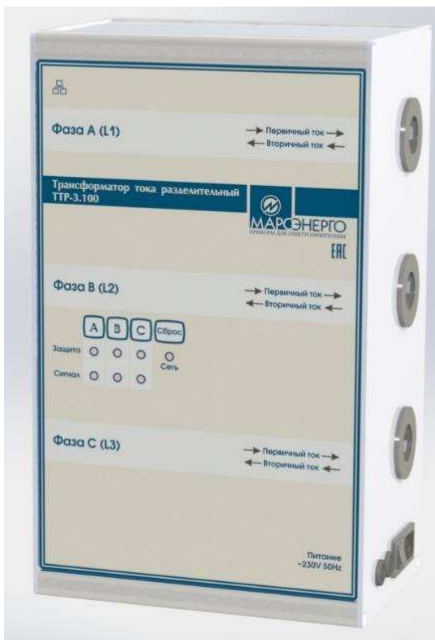
Рисунок 1 - Общий вид изделия