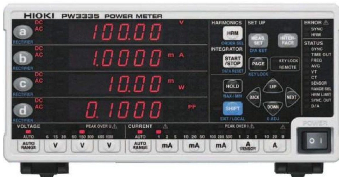
Рисунок 3 – Общий вид измерителей мощности HIOKI PW3335