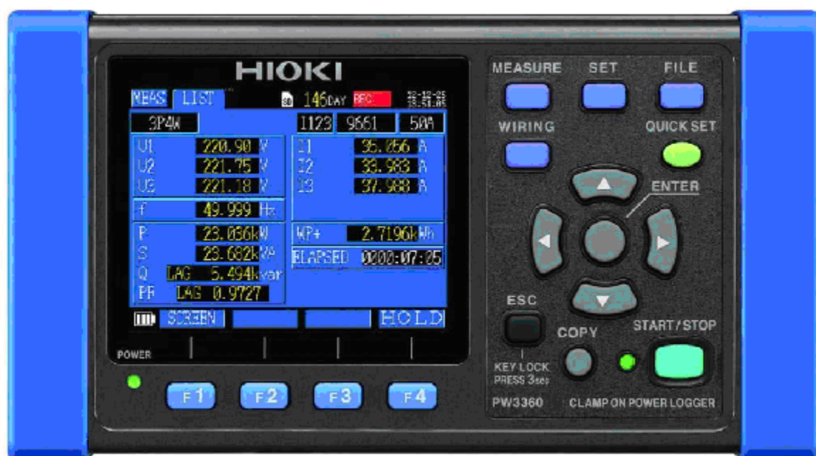
Рисунок 6 – Общий вид измерителей мощности HIOKI PW3360