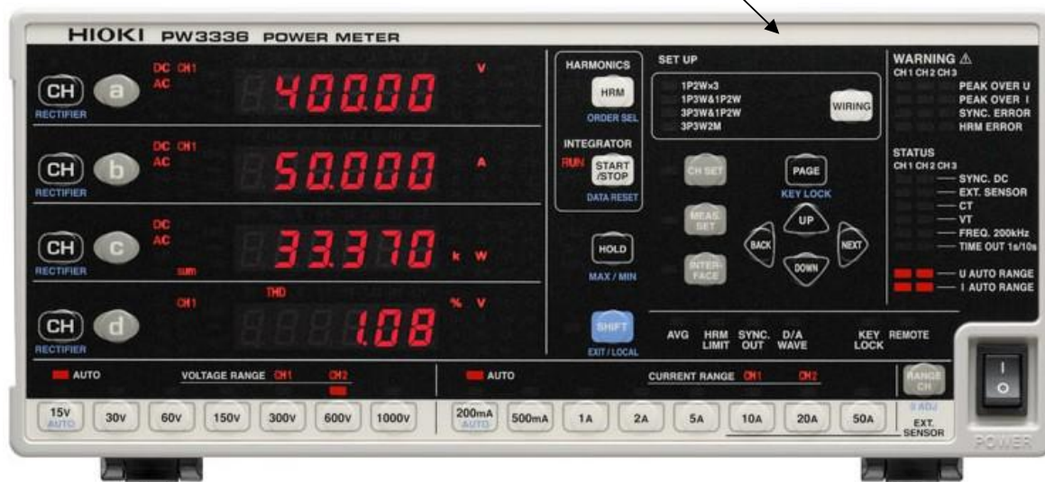
Рисунок 4 – Общий вид измерителей мощности HIOKI PW3336