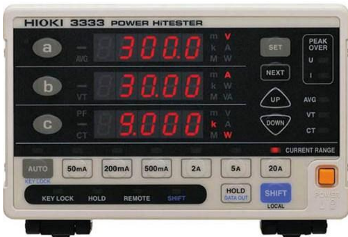
Рисунок 1 – Общий вид измерителей мощности HIOKI 3333