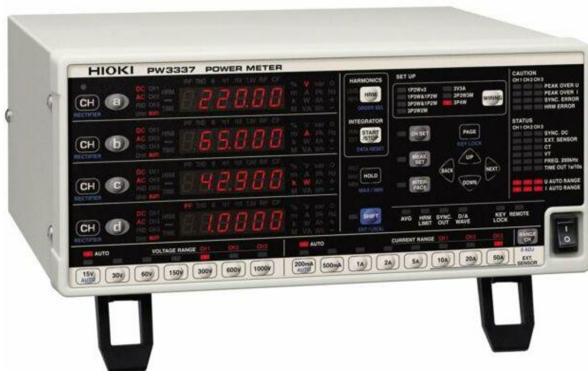
Рисунок 5 – Общий вид измерителей мощности HIOKI PW3337