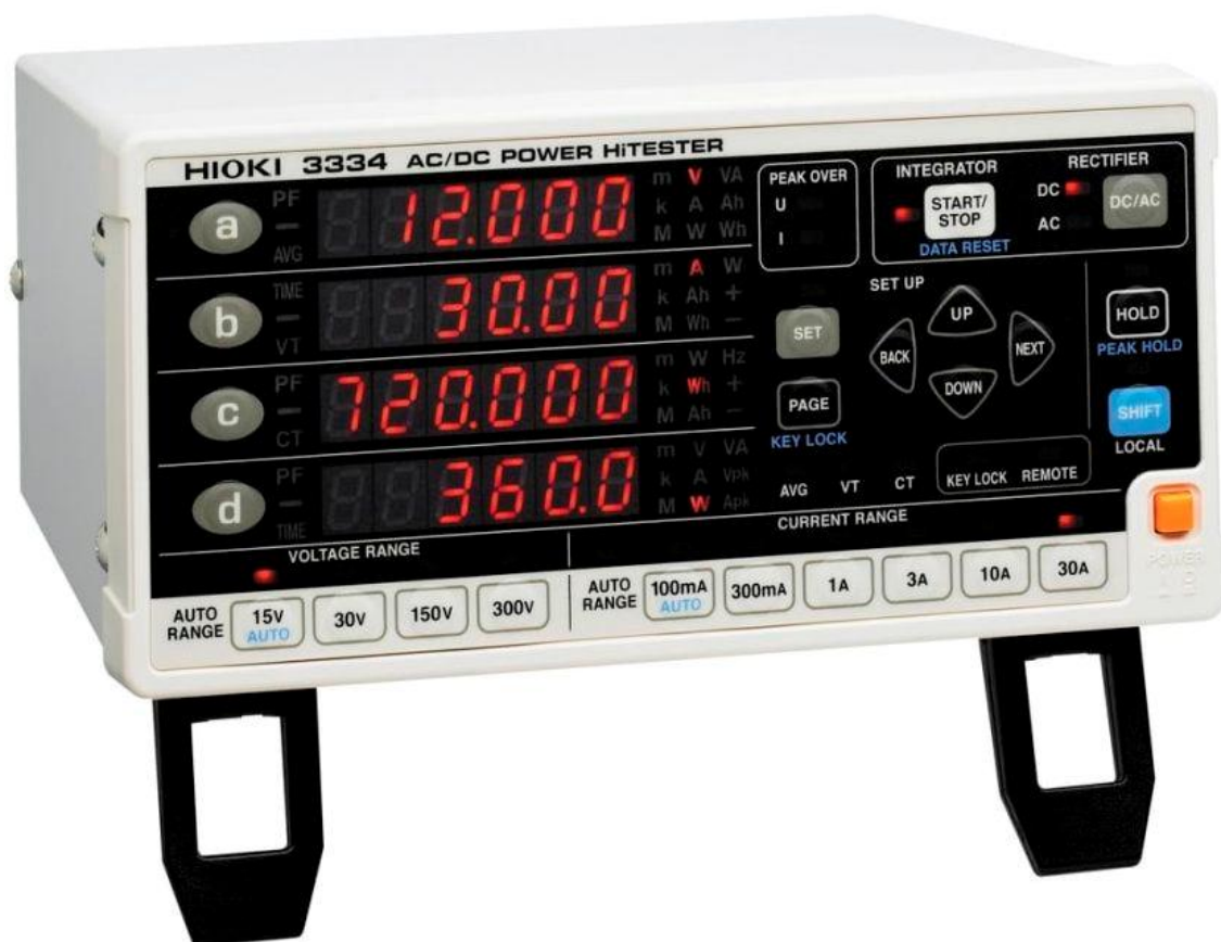
Рисунок 2 – Общий вид измерителей мощности HIOKI 3334