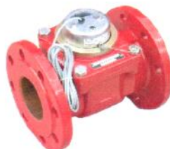
ВСХН, ВСТН, ВСГН