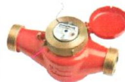
ВСКМ 90 "АТЛАНТ", ОСВ "НЕПТУН"