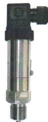
Рисунок 1г - ППД