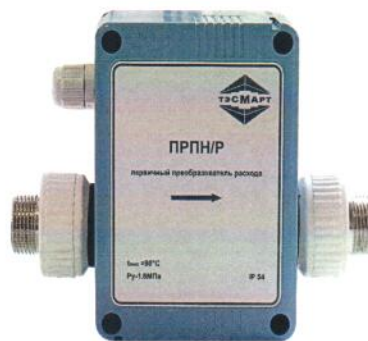
Рисунок 1в - ПРПН/Р