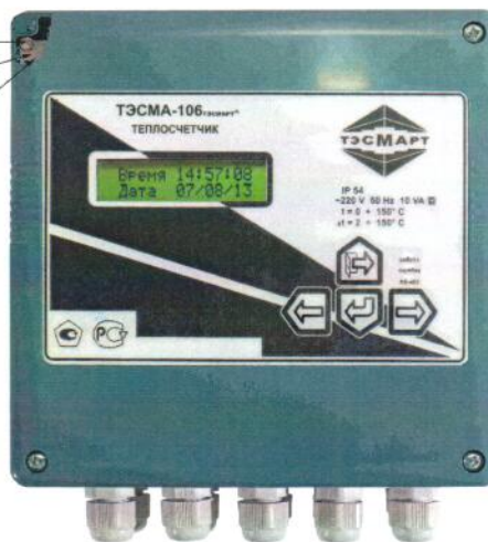
Рисунок 2 - Схема пломбировки от несанкционированного доступа

Контакты, разрешающие программирование микроконтроллера (защищено экраном)