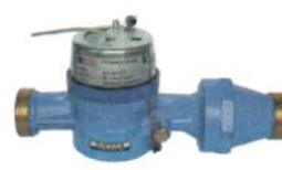
СВ-32, СВ-40 СТРУМЕНЬ