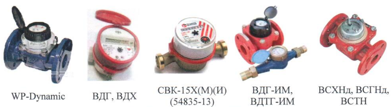
Рисунок 4.2 - Общий вид прочих ИП