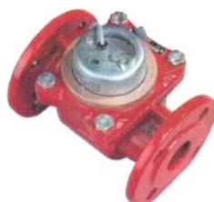
ВСГН, ВСГНд, ВСХН, ВСХНд