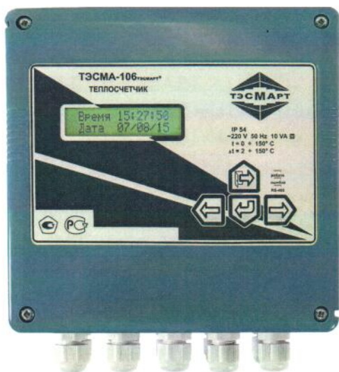
Рисунок 1б - ИВБ