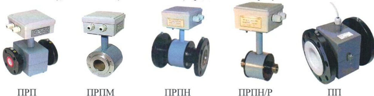
Рисунок 1а - ППР

Схема пломбировки от несанкционированного доступа теплосчётчиков ТЭСМА-106 модификации ТЭСМА-106(ТЭСМАРТ.01), ТЭСМА-106(ТЭСМАРТ.02.1), ТЭСМА-106(ТЭСМАРТ.02.2), ТЭСМА-106(ТЭСМАРТ.02.3) представлена на рисунке 2.