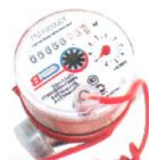
ЕТКИ (ЕТКИ) ВИНДЭКС