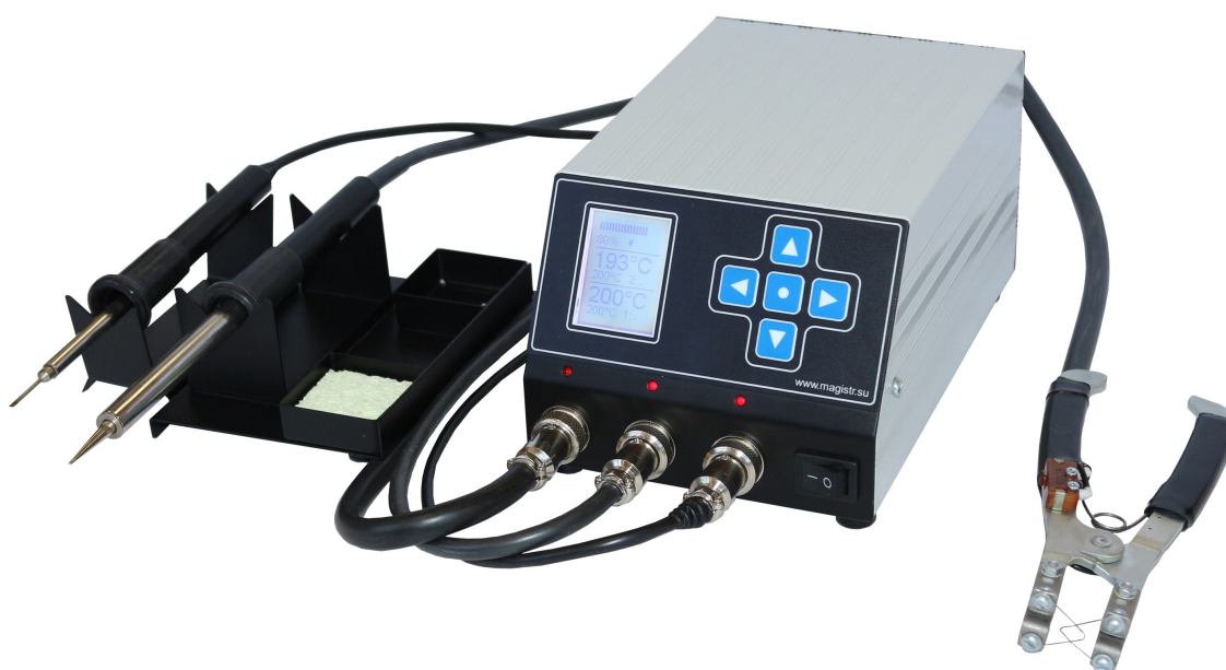
Фото 1. Общий вид станции

Паяльная станция состоит из блока управления и инструментов для пайки и термозачистки. Блок управления выполнен в металлическом корпусе и имеет полную гальваническую развязку от питающей сети. На передней панели блока управления расположены сетевой выключатель, разъемные соединители для подключения трех инструментов (двух паяльных и одного термозачистного), световые индикаторы подключения инструментов, жидкокристаллический дисплей и пятикнопочная клавиатура. На задней панели блока управления находятся сетевой шнур, плавкий предохранитель (5А) и клемма для подключения заземления.