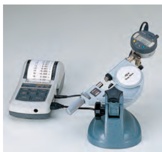
Пример применения: с цифровым индикатором