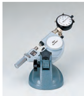
Пример применения: с индикатором часового типа