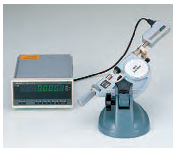
Пример применения: с линейным датчиком