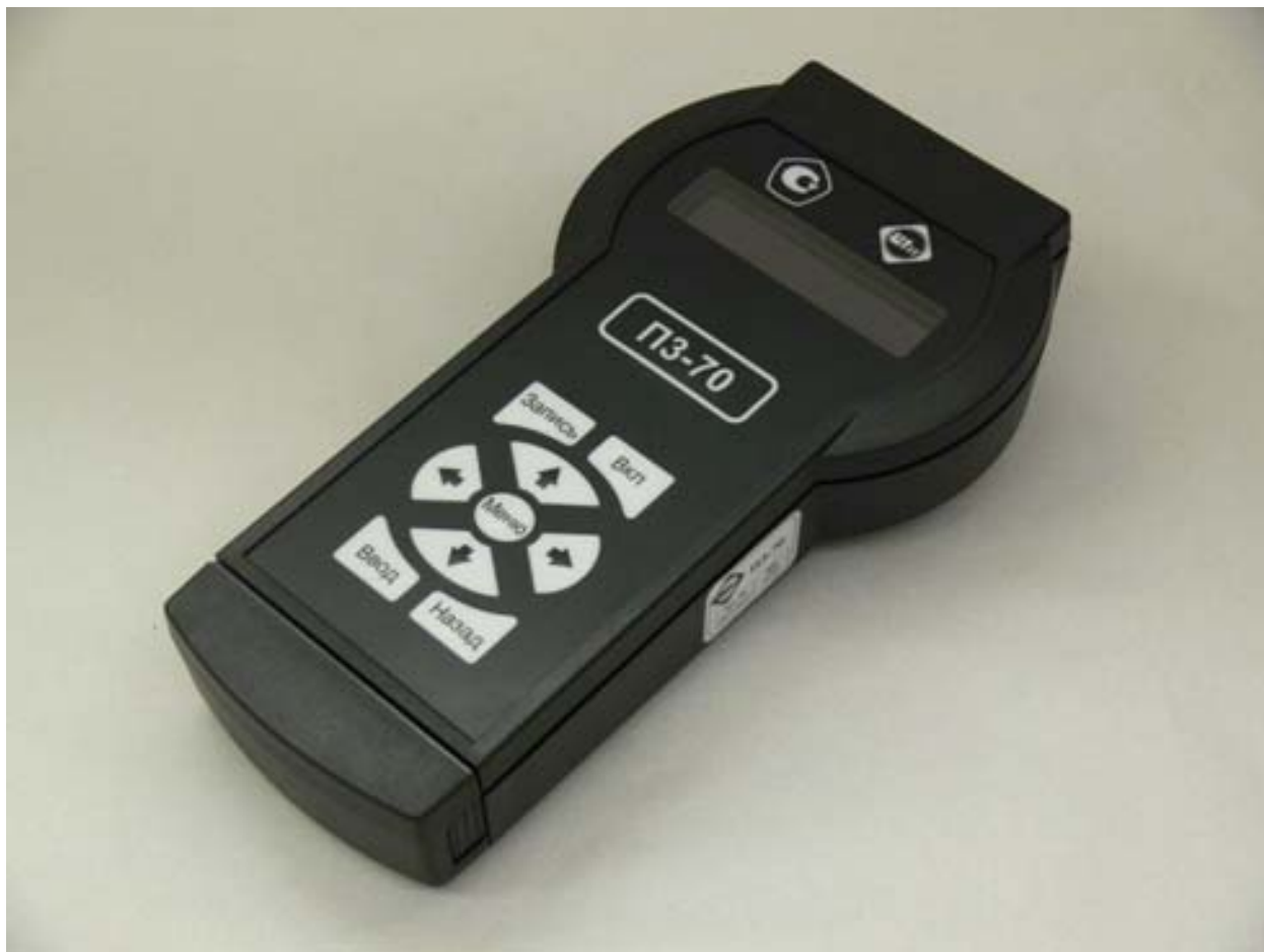
Рис. 1 Внешний вид измерительного блока прибора ПЗ-70.