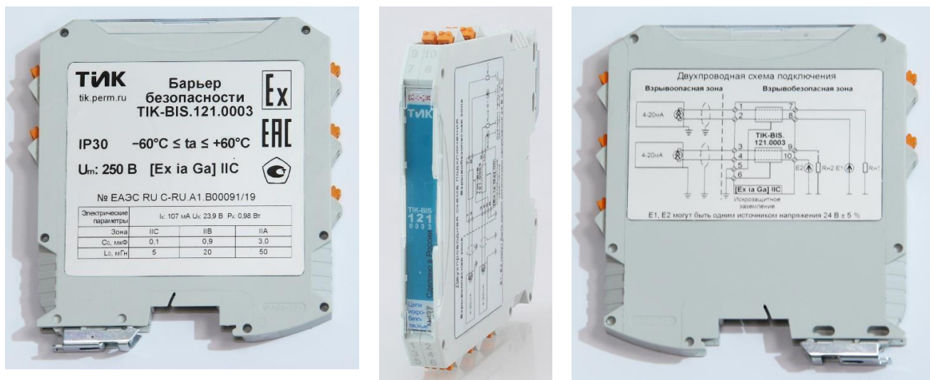
Рисунок 1 – Общий вид барьеров TIK-BIS.1X1.XXXX

Общий вид барьеров представлен на рисунках 1 – 4.