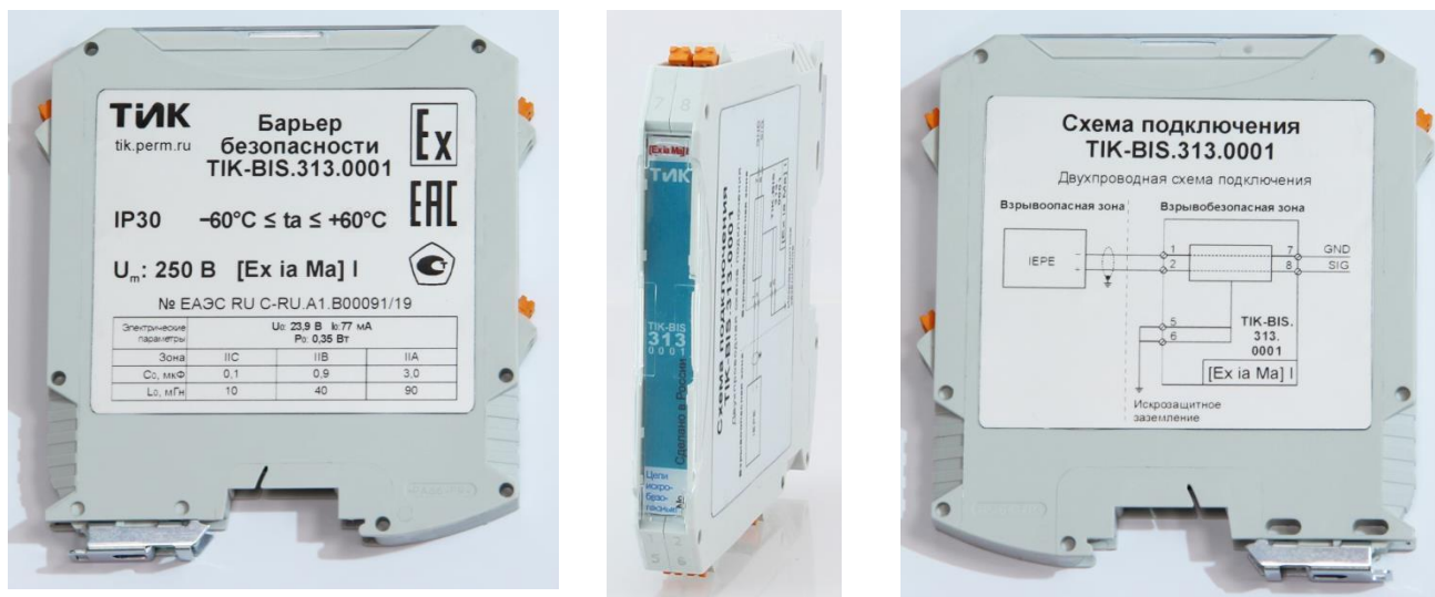
Рисунок 2 – Общий вид барьеров TIK-BIS.3X3.XXXX