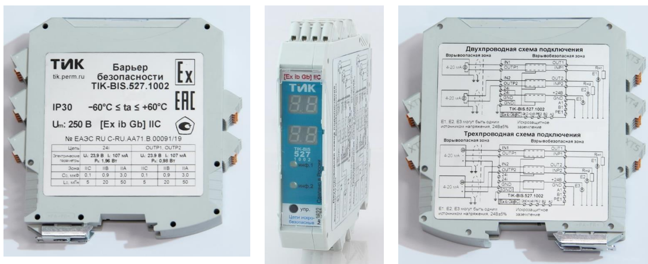
Рисунок 4 – Общий вид барьеров TIK-BIS.527.XXXX

Пломбирование барьеров не предусмотрено.