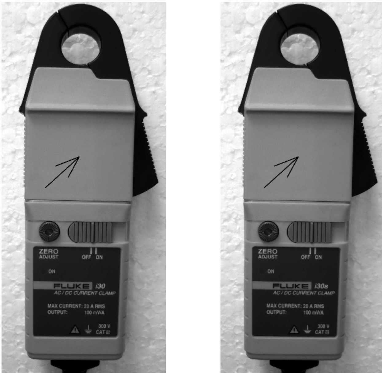
Рисунок 2 - Внешний вид клещей модели Fluke i30 и Fluke i30s, стрелкой показано место нанесения знака утверждения типа.

Клещи используются для подключения к измерительным устройствам, осуществляющим измерение электрического напряжения на выходе клещей и его дальнейшую математическую обработку с учётом установленного коэффициента преобразования клещей.