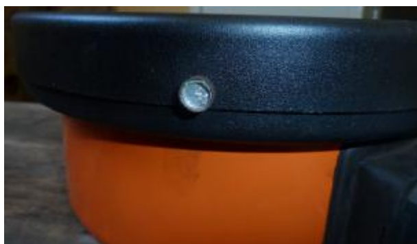
Рисунок 3 – Место пломбировки от несанкционированного доступа