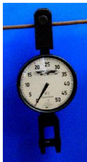
Рисунок 2 – Общий вид динамометров ДПУ-200, ДПУ-500

Маркировка динамометра производится на циферблате, защищенном прозрачным стеклом, на котором нанесены следующие данные: