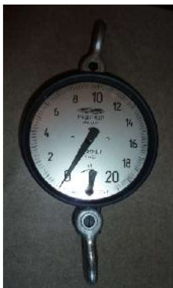
Рисунок 1 – Общий вид динамометров ДПУ-20, ДПУ-50, ДПУ-100

Пять модификаций динамометров отличаются диапазонами измерений, пределами допускаемой погрешности, габаритными размерами и массой.